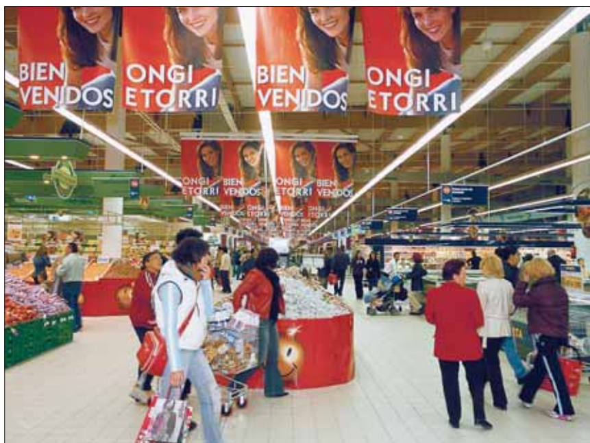
CUADRO Nº 12